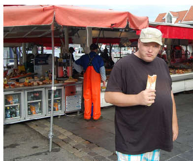
Er man i Bergen, er en tur innom Fisketorget obligatorisk, så frokosten ble denne dagen inntatt nettopp på Fisketorget.